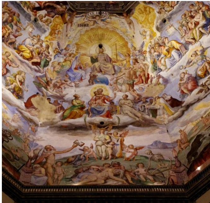
Cupola S. Maria Novella - Giudizio universale

E quindi non capiremo nulla dell'umanesimo cristiano e le nostre parole saranno belle, colte, raffinate, ma non saranno parole di fede. Saranno parole che risuonano a vuoto ..."