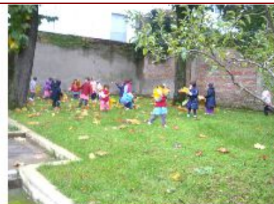
LO SPAZIO ESTERNO

GENITORI E BAMBINI SONO INVITATI OPEN DAY