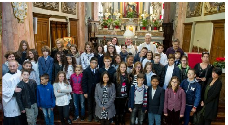
S. Cresime del 7 novembre - turno h 11.15