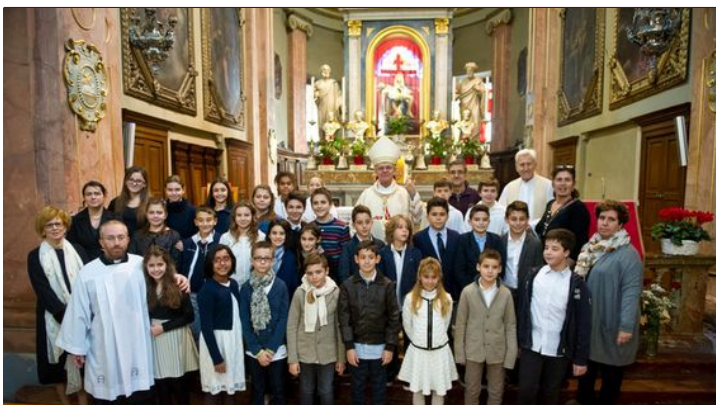
S. Cresime del 7 novembre - turno h 9.30